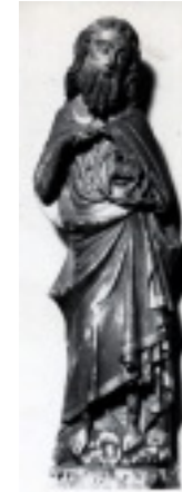
یحیی تعمید دهنده - مجسمه ای در موزه لیون فرانسه

یعقوب سهیم باشد. به علاوه بر حسب سنت متأخر یهود نام اسرائیل به معنای زیباترین نامها به مانند «کسی که خدا را می بیند» تعبیر گردیده است. نتنائیل «پاکدل» (ر. ک موعظه عیسی بر کوه مت ۵:۸) شایسته و سزاوار آن بوده است که «خدا را ببیند». عیسی به وی که معرف ایمانداران با روحی ساده و راست است می گوید: «شما خواهید دید...» آنها چه خواهند دید؟ آنان تحقق رؤیای یعقوب، پدر قوم را خواهند دید، آنان فرشتگان را خواهند دید که بر پسر انسان که از این پس تنها رابط بین آسمان و زمین است، صعود و نزول می کنند. فرشتگان نشان شکوه اند، شکوهی که اعلام کننده نخستین «نشان های» عیسی است.