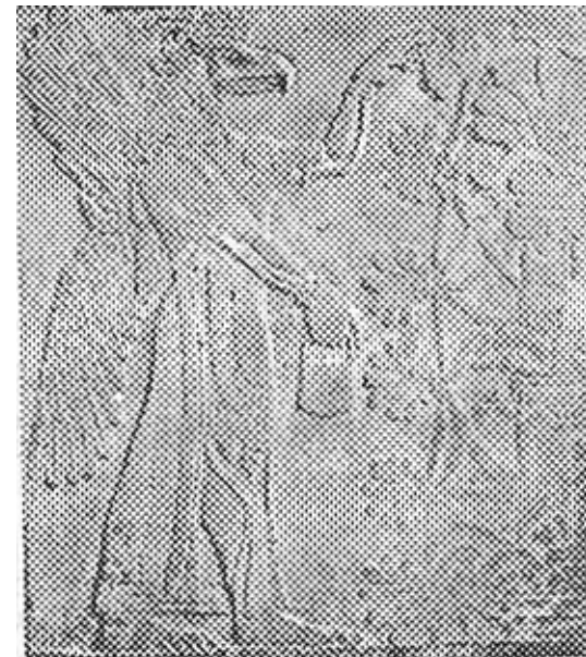
الهه آشوری در حال محافظت از درخت مقدس ( موزه لوور )

سرانجام تشبیهات پر قدرتی از شبانان به عمل آمده. شبانان به اسرائیل او را به سوی ویرانی و پراکندگی برده اند (۱/۳۴ - ۹). شبانان نیکو، خود خداوند گله اش را به مرتعهای نیکو برده و از گوسفند زخمی مراقبت می نماید (۱۰/۳۴ - ۱۶). او به کمک حیوانات بیمار می آید و در مقابل حیوانات فربه از ایشان دفاع می کند. او میان بزها و قوچها داوری می نماید (۱۷/۳۴ - ۲۲). او گله خود را تحت رهبری داور جمع آوری می کند (۲۳/۳۴ - ۲۴) و با وی عهد سلامتی می بندد تا او دوباره در امنیت در کشور ساکن شود (۲۵/۳۴ - ۳۰). «و خداوند بیهوه می گوید شما ای گله من و ای گوسفندان مرتع من انسان هستید و من خدای شما می باشم» (۳۱/۳۴). خوانندگان مسیحی این متن بدون زحمتی می توانند تشبیهاتی؟ عیسی در مثلهای خود به کار می برده در این متن باز شناسند.